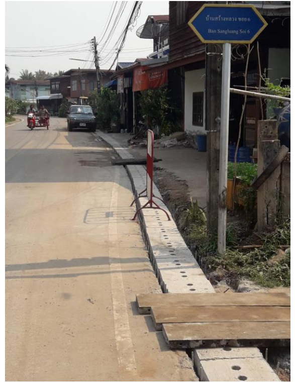
โครงการก่อสร้างวางระบายน้ำ ค.ส.ล. รูปตัว หน้าบ้าน นายฤกษ์กรณ์ สอนพงษ์ (ต่อโครงการเดิม) ภายในหมู่บ้าน บ้านสร้างหลวง หมู่ที่ ๔ ตำบลบ้านเตือ อำเภอกำแพง จังหวัดหนองคาย