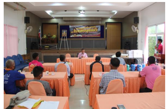
วันที่ ๑๖ มิ.ย. ๒๕๖๓ อบต.บ้านเตือ องค์การบริหารส่วนตำบลบ้านเตือจัดกิจกรรมโครงการสัตว์ปลอดโรค คนปลอดภัย จาก โรคพิษสุนัขบ้า ประจำปีงบประมาณ ๒๕๖๓