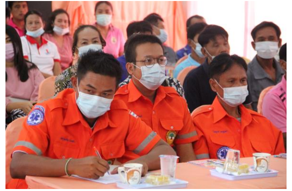
วันที่ ๘ ก.ย. ๒๕๖๓ อบต.บ้านเตือ จัดโครงการปฐมพยาบาลเบื้องต้นและการช่วยชีวิตขั้นพื้นฐาน (CPR) ณ อาคารอู่ทุมพร ห้องประชุม อบต.บ้านเตือ